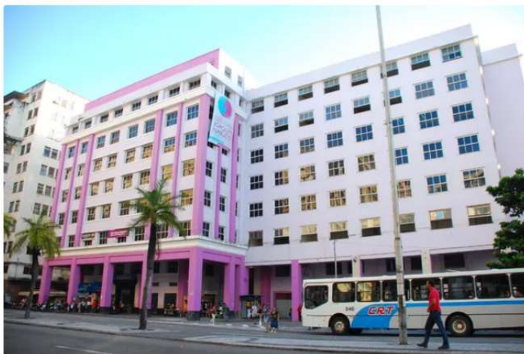
Faculdade Joaquim Nabuco, no Centro do Recife

02/03/2018 06h16 · Atualizado 02/03/2018 06h16